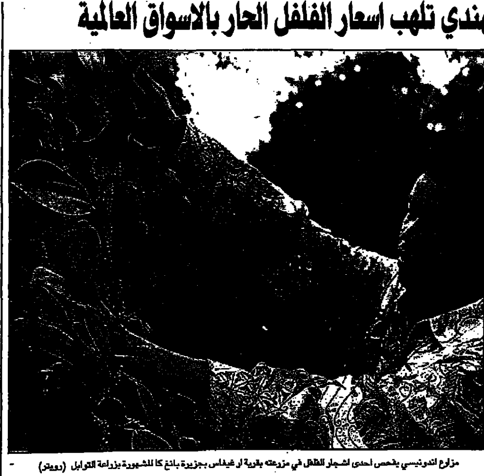
مزارع التوتونيسي يجمع إحدى اشجار الفلفل في مزرعته بقرية ن غرياس بجزيرة بانك كاشيورة بجزيرة التوابل (ديوت)

لندن - القدس العربي: يتوقع كبار التجار والتجار في التجارة الدولية بالعام ان جانب حبة روتنارد الهولندية، ارتفاعا حاداً.